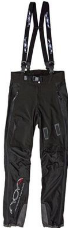
Softshell pants verkrijgbaar in de maten S,M,L,XL prijs € 125,-