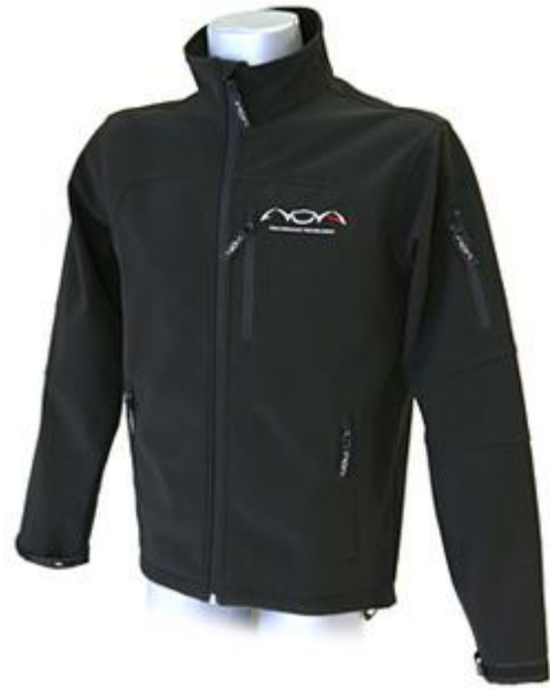
Softshell jacket verkrijgbaar in de maten S,M,L,XL prijs € 82,50